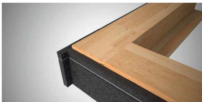
Réalisation des angles en pose en tunnel