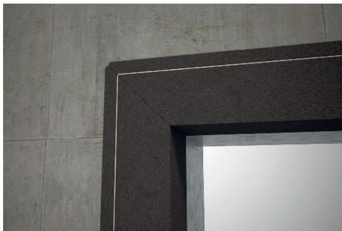
Réalisation des angles en pose en applique